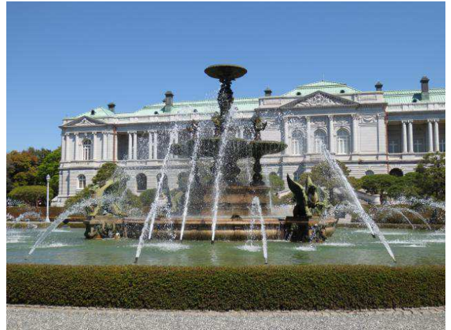
赤坂離宮迎賓館 本館 噴水池